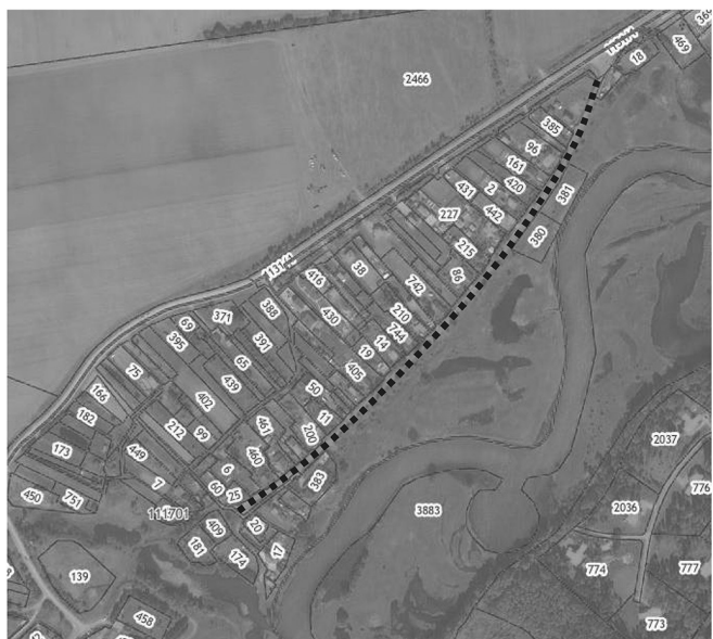
СХЕМА РАЗМЕЩЕНИЯ УЛИЧНО-ДОРОЖНОЙ СЕТИ